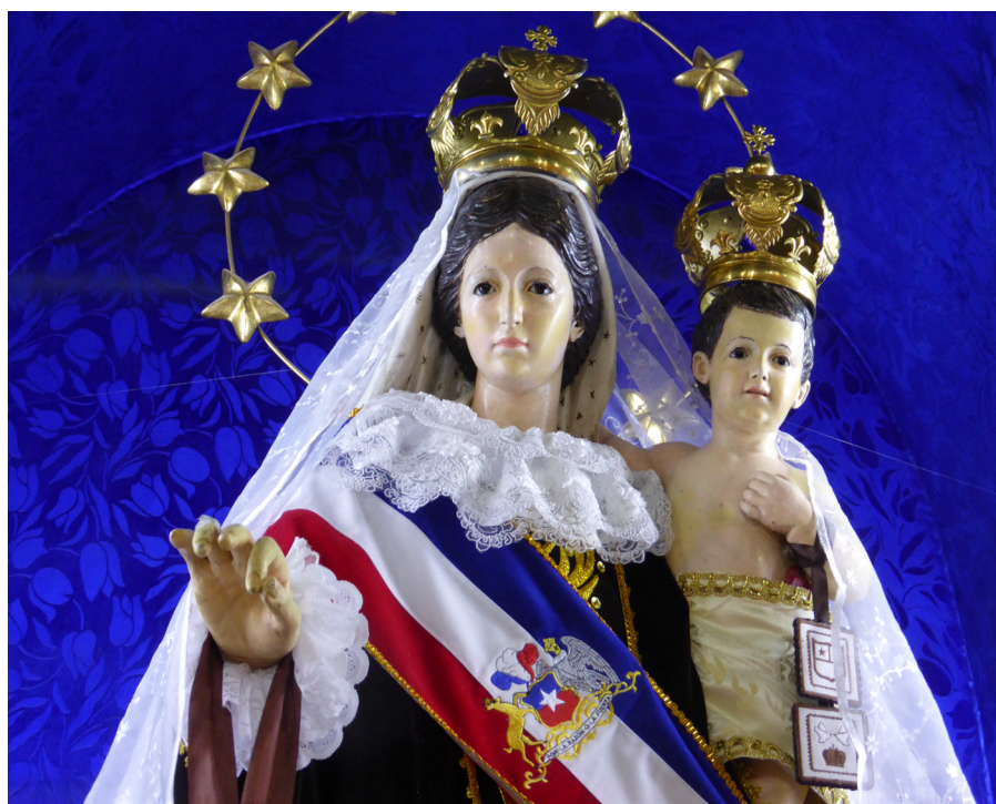
Virgen del Carmen de La Tirana, Chile