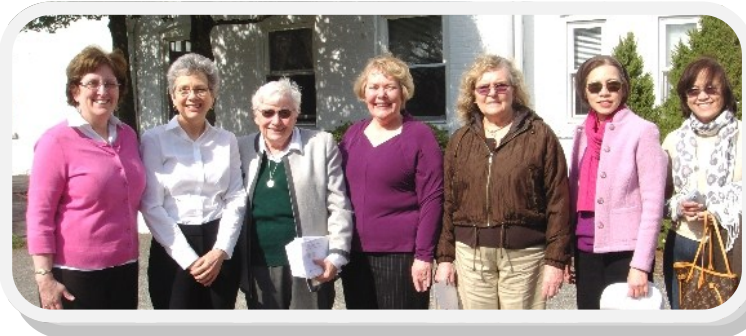
Reunión Regional en Rye—Compartiendo nuestras Historias

socios de SHCJ a través de la provincia americana y otros lugares en la sociedad. La retroalimentación ha sido extremadamente positiva: esperamos publicar material adicional en el futuro.