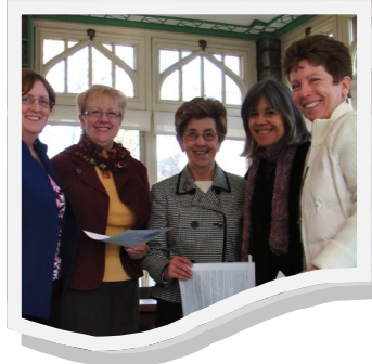
Compartiendo nuestras Historias, Rosemont